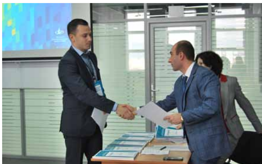
Все участники конференции получили сертификаты

Конференция продолжила свою работу по секциям, которые отразили основные направления деятельности Федеральной