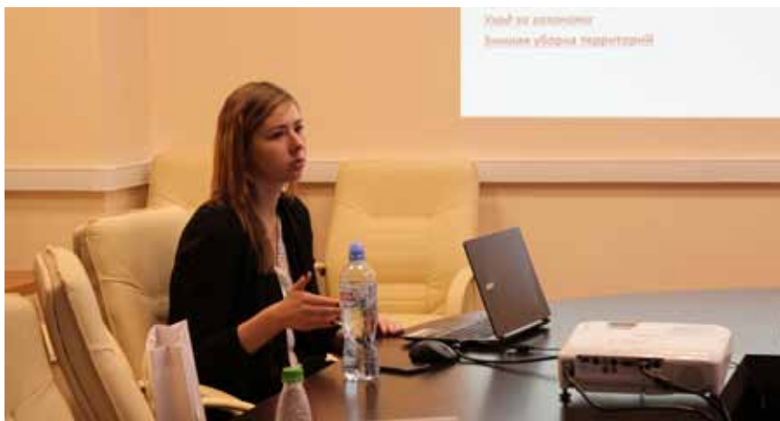
Специалисты отдела обжалования государственных закупок наиболее компетентны в реализации 44-ФЗ

24-25 октября в филиале УМЦ ФАС России (г. Москва) прошел семинар по практике применения Федерального закона № 44-ФЗ